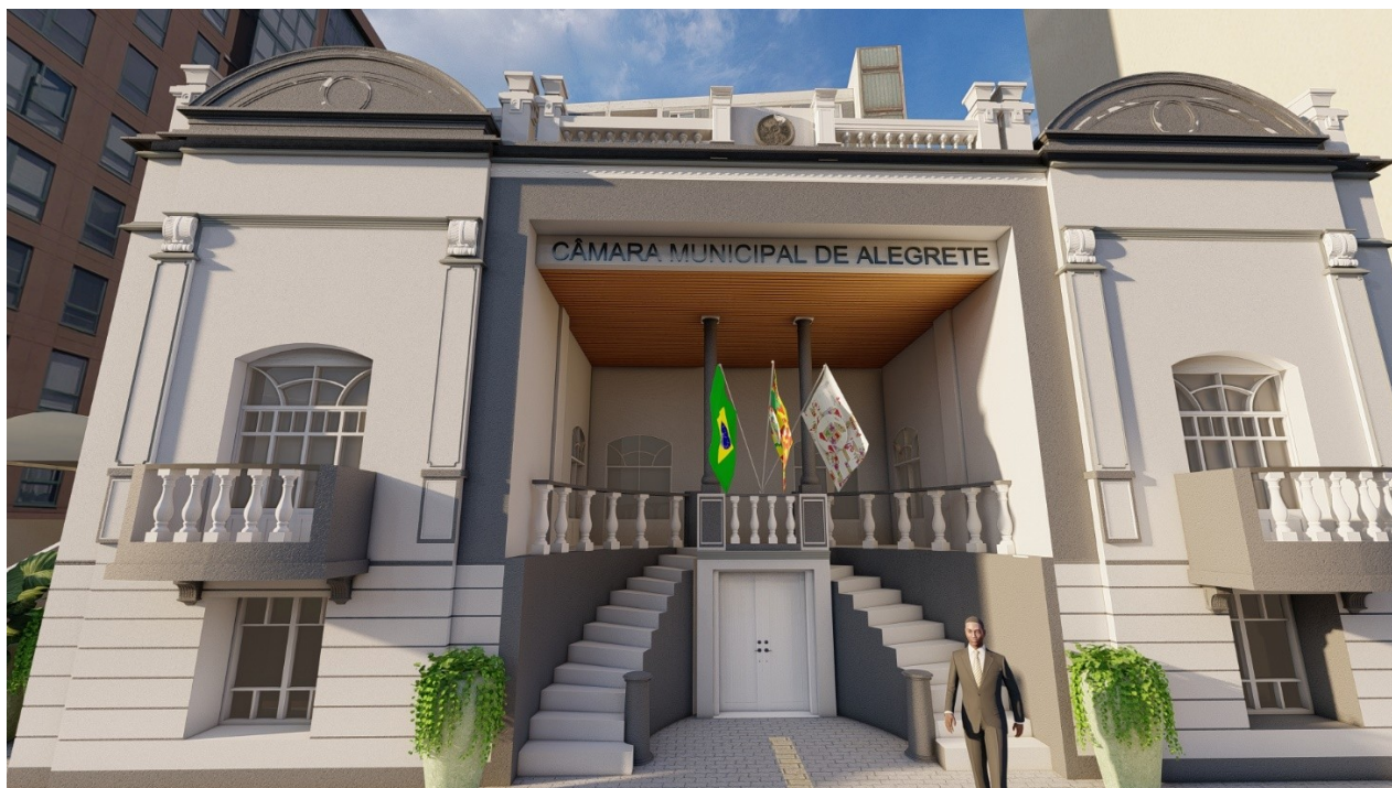
Figura 3 - Fachada Edifício