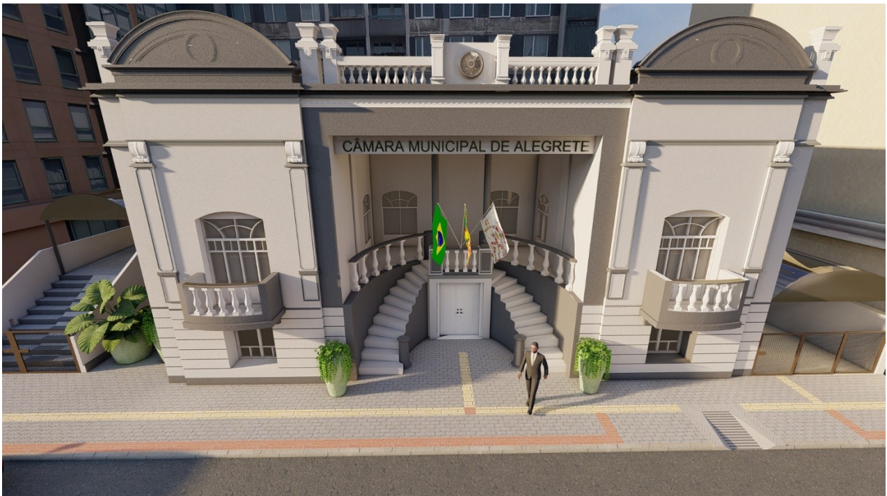
Figura 2 - Fachada Edifício

Alegrete, "Doe sangue, Doe órgãos, salve vidas".