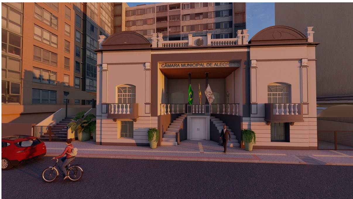
Figura 1 - Fachada Edifício

1.3. Abaixo segue imagens da fachada de como o edifício ficará.